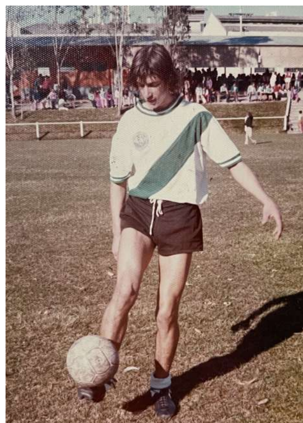
Com 18 anos, em 1975, quando integrava o time da Fumossul

Num desses jogos na vila, ele foi convidado pelo 'Tião do Guarani' para treinar com outros meninos. "Era tipo uma escolinha do Guarani, mas cada um levava uma camisa branca para o treino. Não era como hoje. Logo depois, comecei no time da Fumossul, onde fiquei até os 18 anos. Foi na fumageira meu primeiro emprego também."