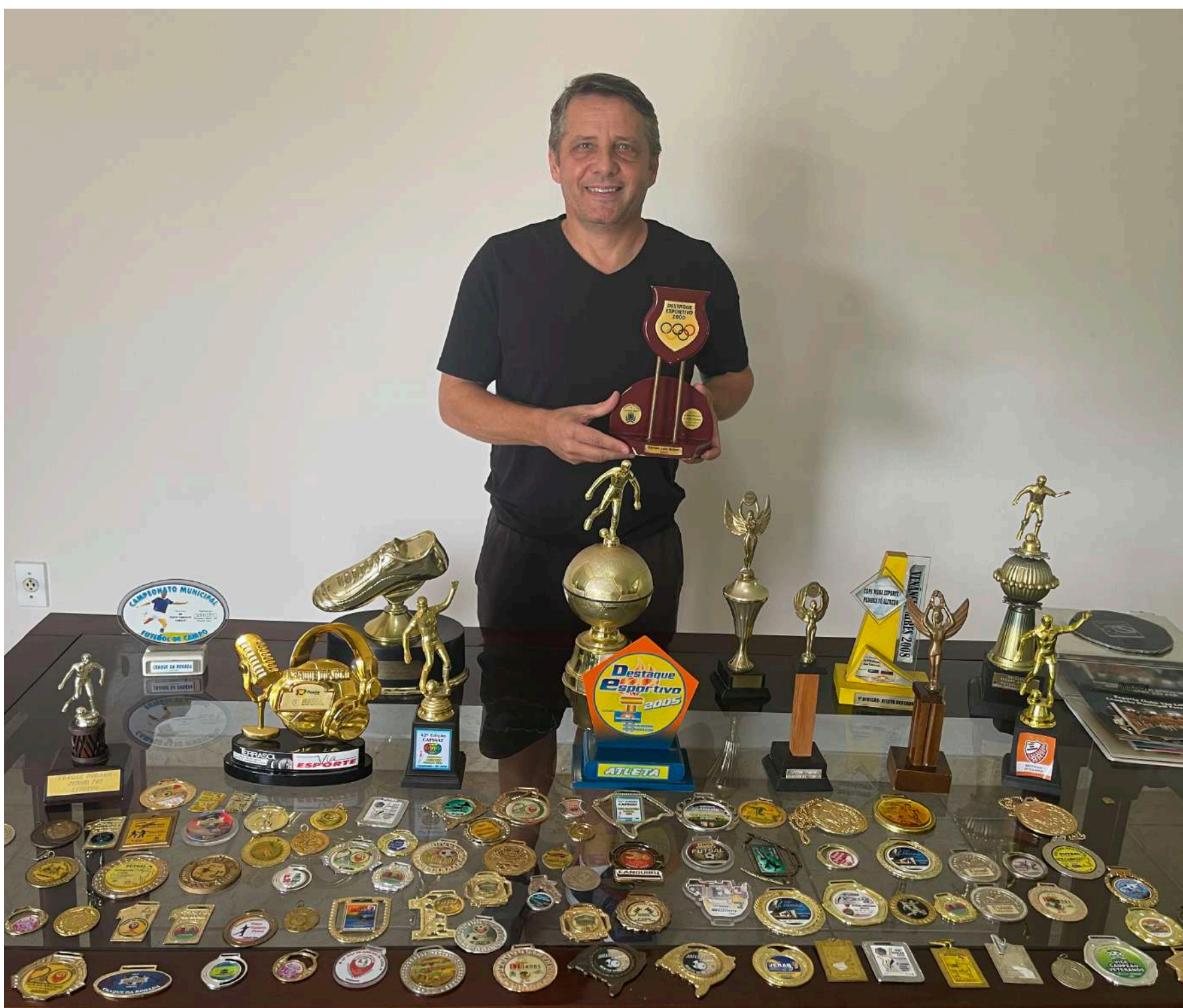
Coleção de medalhas e troféus de prêmios individuais estão guardados em casa