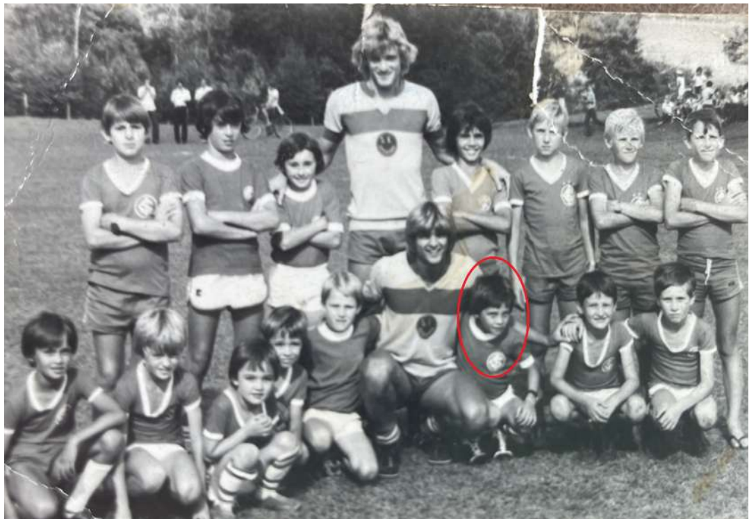
Em 1981, com 8 anos, Gersinho participou de um jogo festivo com o jogador venâncio-airense Cléo Hickmann, então atleta do Internacional

Com oito anos, o pequeno colorado viveu uma emoção inesquecível, ainda viva numa pequena foto em preto e branco. Em dezembro de 1981, Cléo Hickmann, venâncio-airense e jogador do Internacional, esteve na Capital do Chimarrão para um jogo festivo no antigo campo do Operário, em Vila Santa Emília. "Foi uma festa, com carreta e tudo. Aí deram essa alegria para os coloradinhos da época e eu estava lá, batendo bola com um cara que jogou até na Seleção."