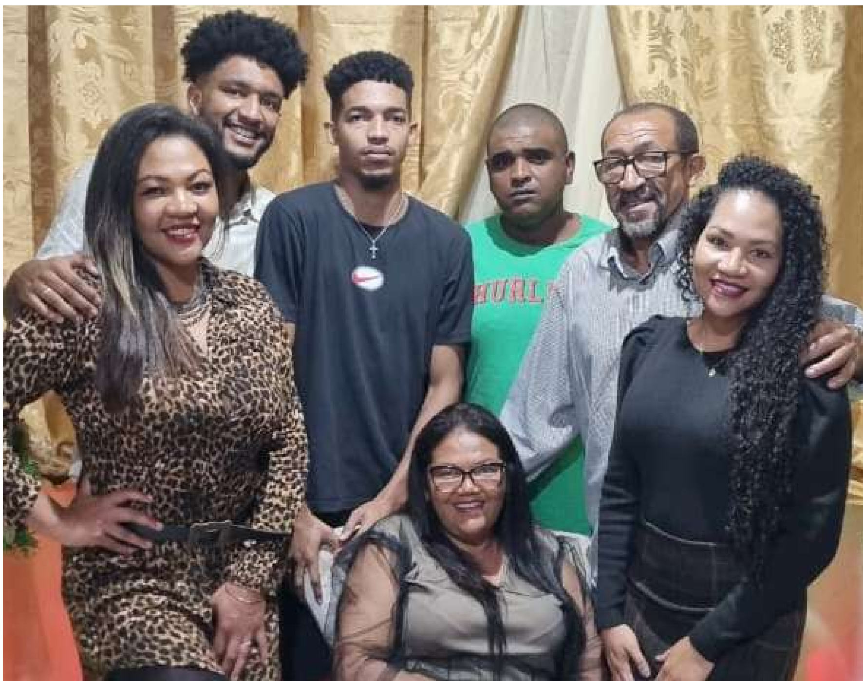
Vovô com a esposa Liege e os cinco filhos