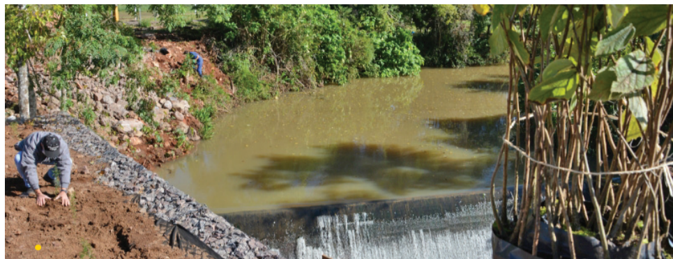
Al Prefeitura de Vera Cruz

Na mesma a assembleia, também foi aprovada a implantação do Programa Papel Zero, que estabelece