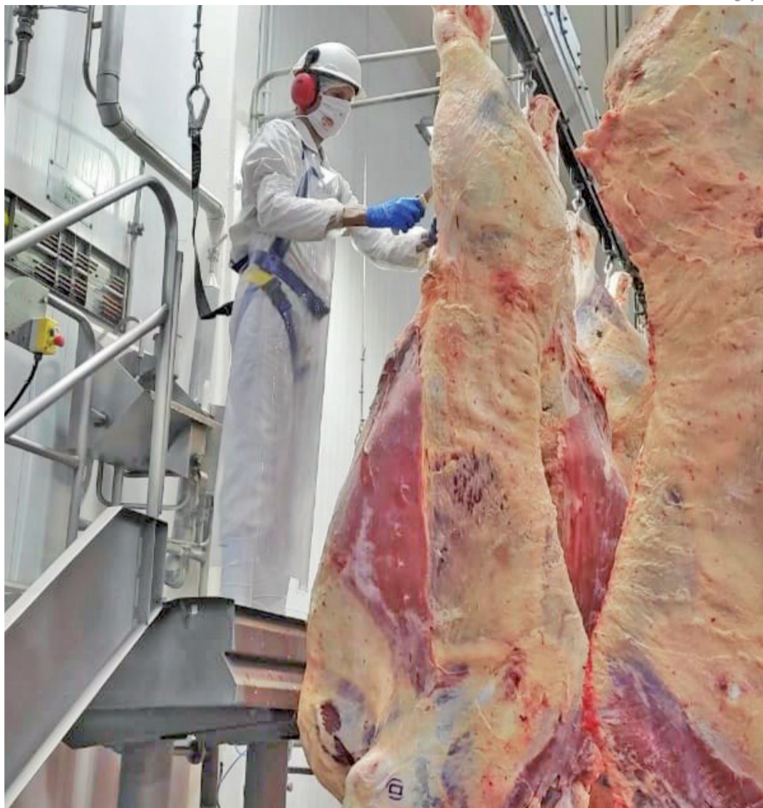
Sector de abate concentra em torno de 90 profissionais, divididos nos turnos do dia e da noite

“É gratificante fazer parte de uma empresa como o Kroth, empreendimento de uma família que se dispõe a seguir com um negócio por 70 anos, mesmo diante de tantos desafios, e onde há muito respeito entre empregadores e empregados.”