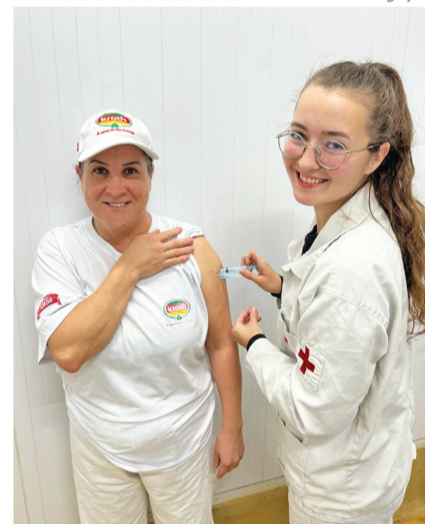
Vacina contra a gripe é oferecida para os colaboradores da empresa, por meio de parceria com a Prefeitura

em Engenharia de Segurança e em Medicina do Trabalho (Sesmt) do Frigorífico Kroth conta com médico do trabalho atuando na empresa, fisioterapeuta, psicólogo, engenheiro de Segurança do Trabalho, técnico em Segurança do Trabalho, enfermeiro e técnico em Enfermagem. Além de atuar com vistas à ergonomia, o setor realiza fiscalização do uso de Equipamentos de Proteção Individual (EPIs) e da segurança de máquinas e equipamentos.