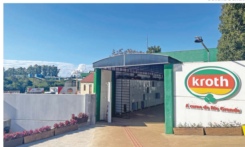
Frigorífico localizado em Vila Santa Emília é a 5ª maior empresa de Venâncio Aires